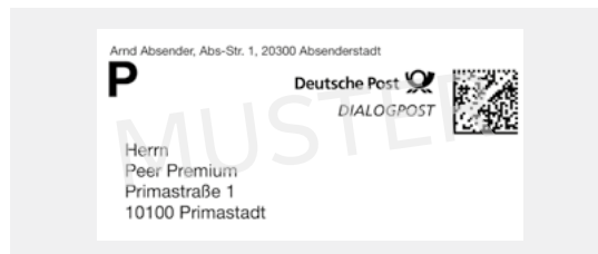
Muster für PREMIUMADDRESS

Bitte beachten Sie: DIALOGPOST ohne PREMIUMADDRESS wird bei Unzustellbarkeit nicht zurückgesandt. Der Absender beauftragt die Deutsche Post bei Unzustellbarkeit von DIALOGPOST ohne PREMIUMADDRESS, die Sendungen in seinem Auftrag nach abfallrechtlichen Bestimmungen und auf seine Kosten zu entsorgen. Bei DIALOGPOST ohne Umhüllung in Kombination mit Premiumadress kann keine Nach- oder Rücksendung erfolgen.