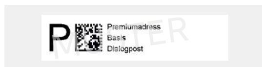
Muster für PREMIUMADDRESS Label zur Darstellung auf dem Umschlag

Preise und Informationen hierzu finden Sie unter premiumadress.de