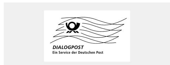
Muster für Frankierwelle DIALOGPOST