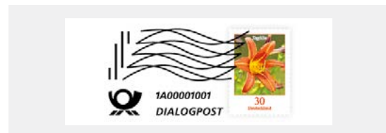
Muster einer Absenderstempelung (Postwertzeichen mit gleichzeitiger Entwertung)

Die Differenzbeträge bis zum nächsthöheren Postwertzeichen ersetzen wir Ihnen. Maximal können 2 Postwertzeichen je Sendung genutzt werden.