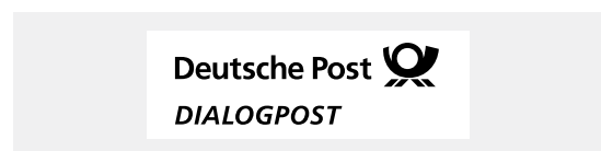
Muster für verkürzten Frankiervermerk

Der verkürzte Frankiervermerk wird innerhalb der Aufschrift angebracht. Der Vermerk ist gut sichtbar/lesbar rechts oberhalb der Anschrift zu platzieren (Muster unter deutschepost.de/frankiervermerk ). Die Frankierzone ist in diesem Fall von alphanumerischen Angaben in Klarschrift und Codes jeglicher Art frei zu halten, darf jedoch farbig bedruckt werden. Für die Frankierung von DIALOGPOST ohne Umhüllung ist der verkürzte Frankiervermerk daher besonders geeignet.