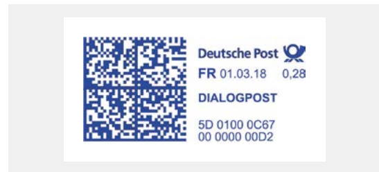
Frankiervermerk über Frankiermaschine

Weitere Einzelheiten zur Frankierung über Frankiermaschinen finden Sie unter frankit.de