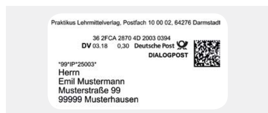
Muster für DV-Freimachung mit Matrixcode im Fenster

Weitere Einzelheiten zur Frankierung über DV-Freimachung finden Sie hier: deutschepost.de/dv-freimachung