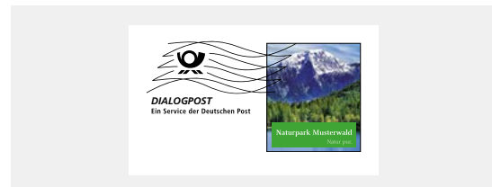
Muster für kundenindividuelle Darstellung DIALOGPOST